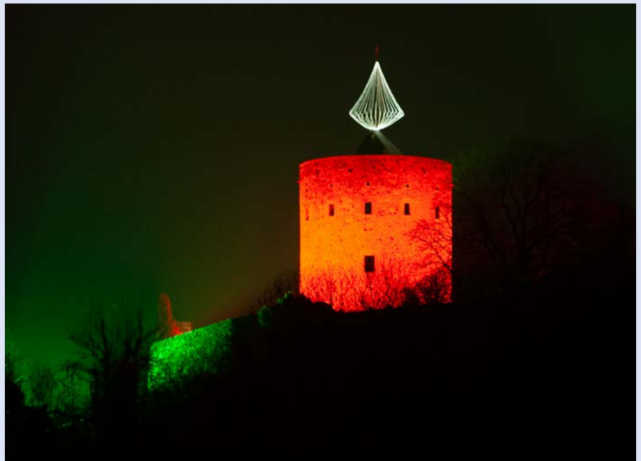
Die Burgkerze in vollem Lichterglanz.